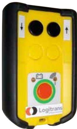
Sender für Funkfernbedienung, RCW 1, bei Fernbedienung in zwei Richtungen.