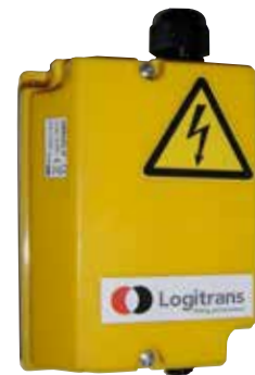
Der Empfänger für die Funkfernbedienung ist am Gerät montiert.