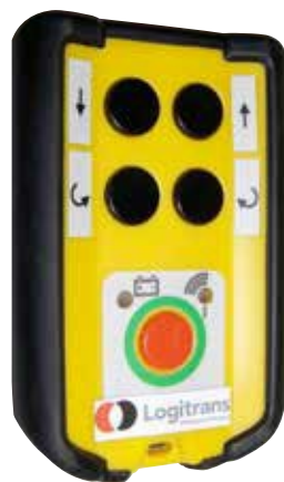
Sender für Funkfernbedienung, RCW 2, bei Fernbedienung in vier Richtungen.