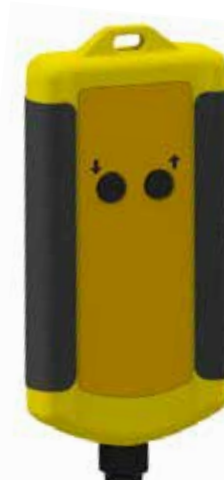
Kabelfernbedienung für Geräte mit elektrischem Hub (Heben/Senken)