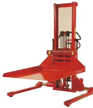
Als Zubehör werden u. a. Plattform und Kranarm angeboten.