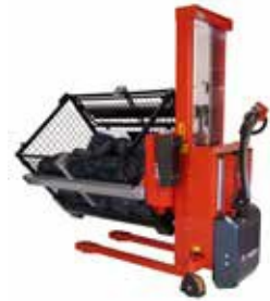
Der Rotator hat für Heben, Senken und Rotation Kabelfernbedienung als Standard. Funkfernbedienung ist für Heben, Senken und Rotation als Zubehör erhältlich.