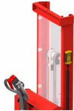
Kabelfernbedienung einfach und bequem am Gerät platzieren.