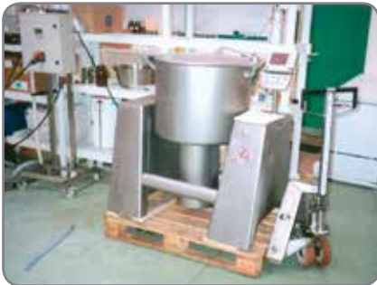
Inox Plus - für die Lebensmittel- und Pharmaindustrie mit hohen Ansprüchen an Hygiene und Reinigung.