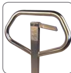
Ergonomische Deichsel sorgt für einen entspannten Griff.