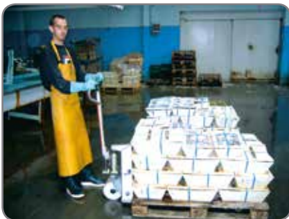
Inox - für die Lebensmittelindustrie in den Gebieten, wo Korrosionsbeständigkeit wichtig ist.