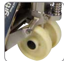
Radlager mit Gummidichtung.

Bitte fordern Sie Werkstoff-Spezifikationen und kundenspezifische Lösungen an. Besuchen Sie auch www.logitrans.com