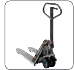
Panther Inox Plus ist auch in explosionsgeschützter Ausführung erhältlich.