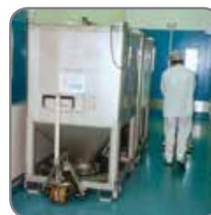
Der Gabelhubwagen hier in der Pharmaindustrie.