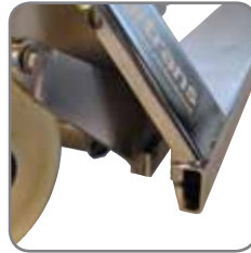
2-seitig offene oder völlig geschlossene Hohlräume ermöglichen eine effektive Reinigung.